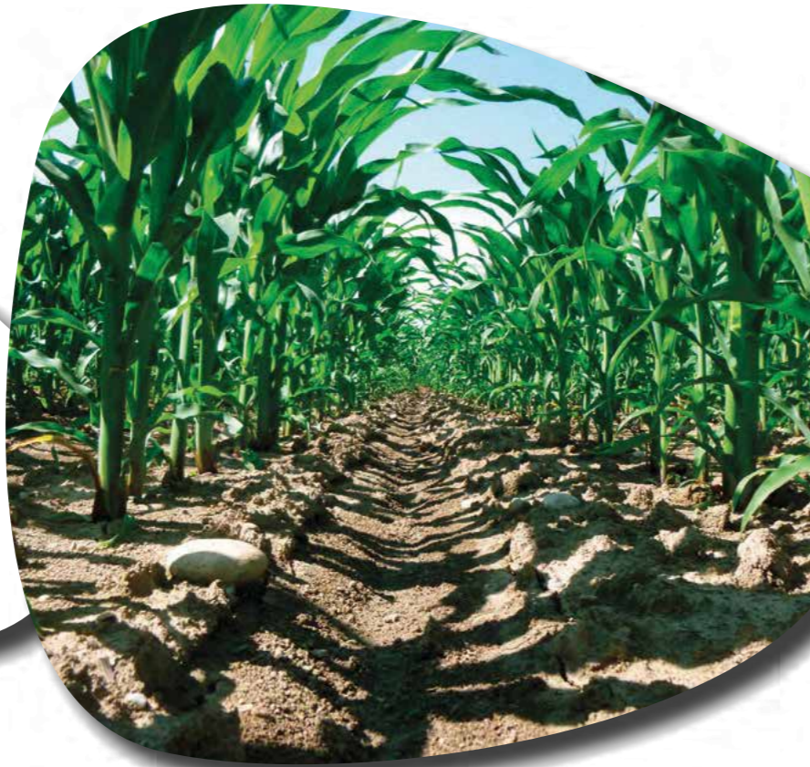
40 ditë pas trajtimit

Kontrollon 100% graminorët dikotiledonet