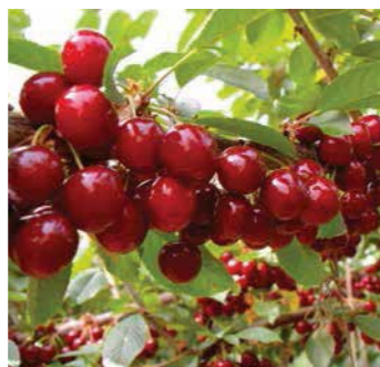
I domosdoshëm akumulimin dhe cilësinë