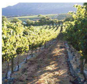
Zhvillim i dobët për shkak të fitotoksicitetit