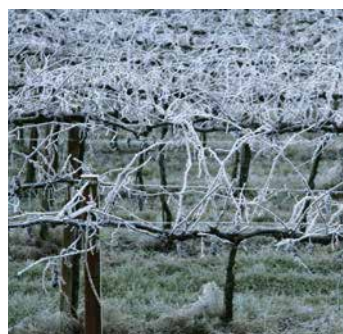
Stresi nga i ftohti