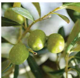
Mbyllja e gojësve për shkak të thatësisë