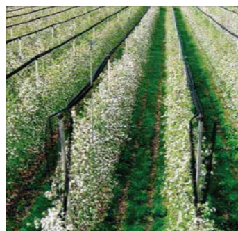
Lulëzim i bollshëm