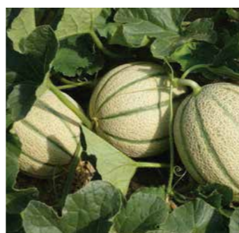
Rritje të prodhimit