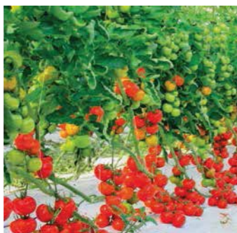
Prodhim i lartë